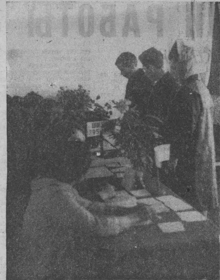
Избирательный участок № 76 (школа № 20) гостеприимно встречает избирателей.

ГОРОДСКАЯ ИЗБИРАТЕЛЬНАЯ КОМИССИЯ ПРОСИТ ИЗБРАННЫХ ДЕПУТАТОВ В ЛЕНИНСК-КУЗНЕЦКИЙ ГОРОДСКОЙ СОВЕТ ПРОЙТИ РЕГИСТРАЦИЮ В ИСПОЛКОМЕ ГОРОДСКОГО СОВЕТА ДО 20 ИЮНЯ. КОМНАТА № 29.