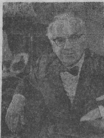
Сотни самых разнообразных ролей в спектаклях и в кинофильмах сыграл за свои творческие полвека актер Государственного Академического Малого театра народный артист

СССР, трижды лауреат Государственной премии Игорь Владимирович Ильинский.