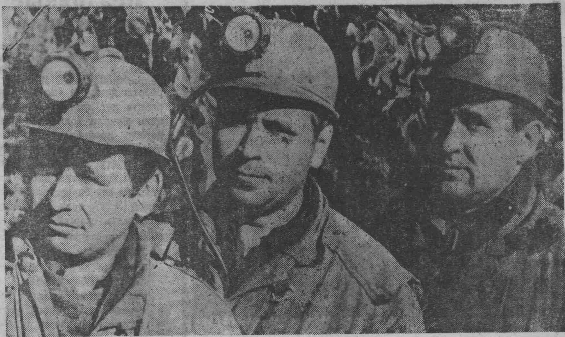
Монтировать сложные водоотливные установки, поддерживать закрепленные за участком горные выработки в исправном состоянии способствуют одни из лучших рабочих участка водоотлива шахты «Польса-