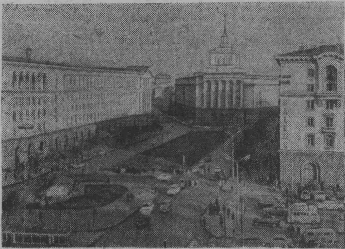
СОФИЯ. ПЛОЩАДЬ ИМЕНИ ЛЕНИНА.

Обращаться по адресу: проспект Ленина, 9 (остановка автобуса «Шахта имени Ярославского», телефон 2-27-67).