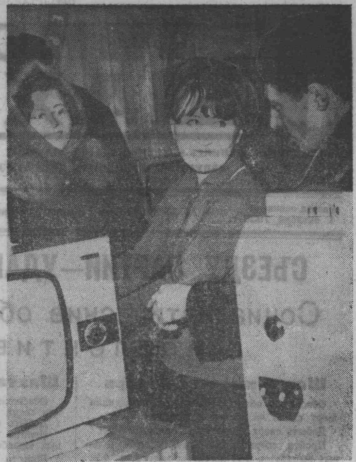
Большой популярностью у горожан пользуется специализированный магазин «Мелодия». В магазине всегда поддерживается ассортимент радиотоваров, а отсюда и результаты: план прошедшего года перевыполнен на 150 тысяч рублей. Неплохие показатели у коллектива в этом году. На их отчету уже имеется более 14 тысяч рублей сверх плана.