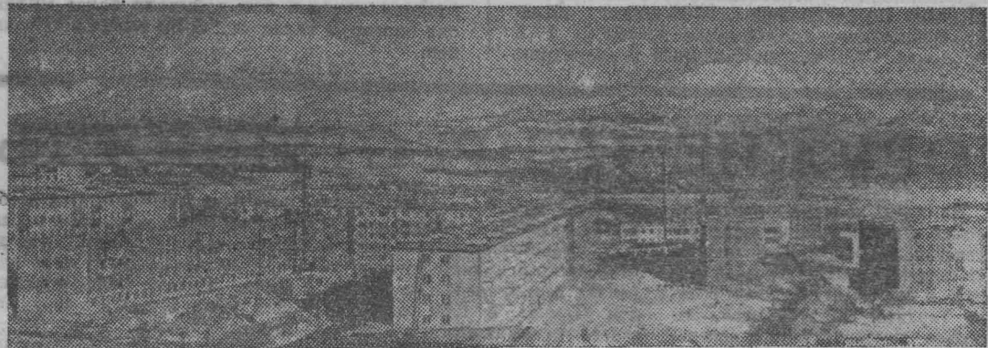
Этот новый жилой массив для семей моряков и рыбаков вырос у подножия Корякского и