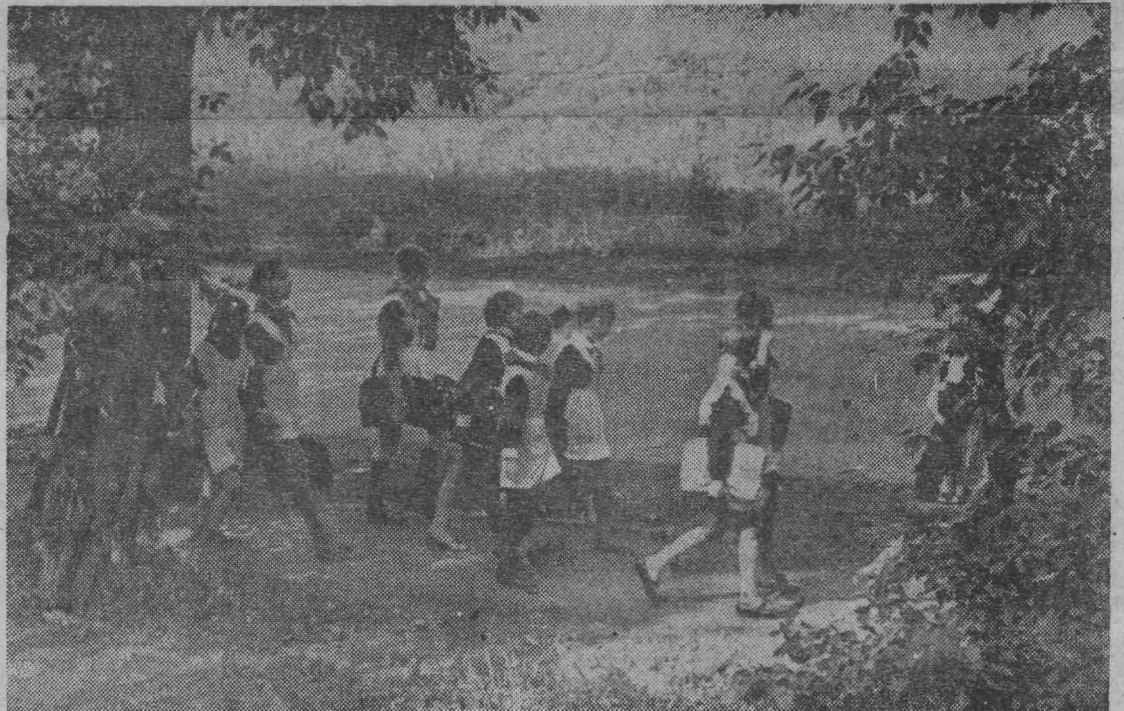
ДОРОГА В ШКОЛУ.