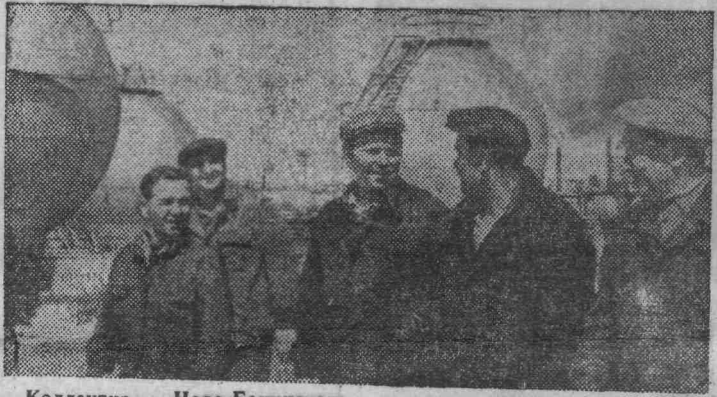
Коллектив Ново-Бакинского нефтеперерабатывающего завода имени Владимира Ильича с первых же дней новой пятилетки взял уверенный старт. С начала года сверх плана выработано на сотни тысяч рублей нефтепродуктов.