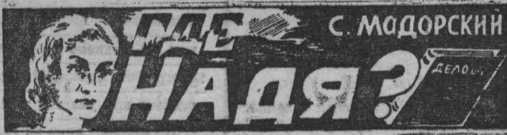
(ИЗ ЗАПИСОК ПРОКУРОРА)

«Выходит, напрасно завели мы розыскное дело», — по-