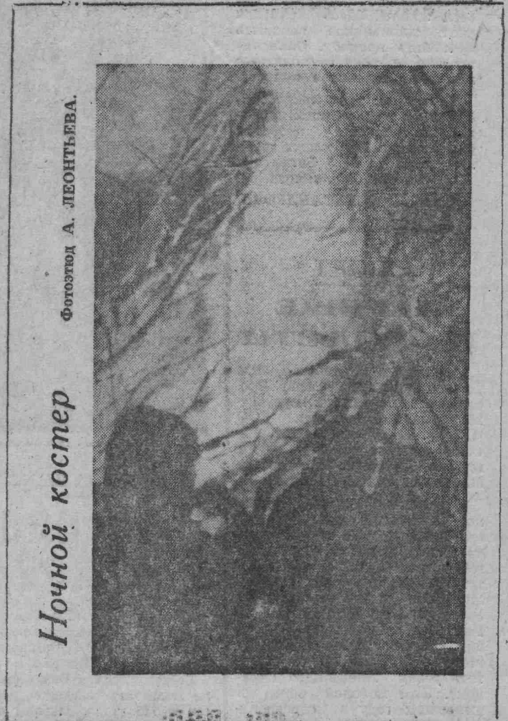
Ночной костер

Будто просят, чтоб в чем-то помог, Тихо просят — под солнцем искристы, Беззащитностью детской сильны. О, мой цех, — беспокойная пристань — Я не знал тебе верной цены! Я не знал, до чего же я слеп, Но приходит пора — оглядеться: Люди входят в цеха, словно в детство, Чтобы стать (непрерывно!) взрослей.