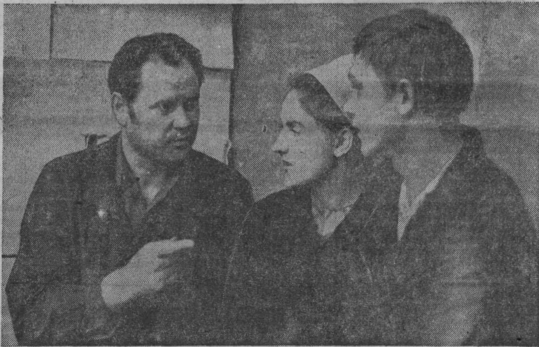
Комсомольская организация 8-го цеха электролампового завода — одна из самых многочисленных на предприятии. И за последнее время в ее организации заметно поднялась активность комсомольцев.

Намечены и другие важные пути к устранению недостатков в партийной и производственной деятельности.