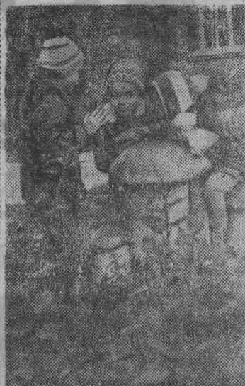
«Расширить сеть детских учреждений. Построить за пятилетие за счет государства дошкольные учреждения более чем на два миллиона мест...»