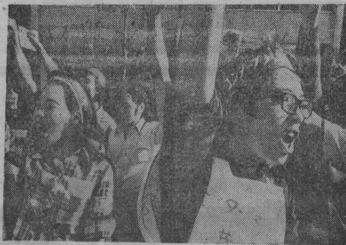
ЯПОНИЯ. Более 6 тысяч молодых японцев со всех концов префектуры Конто собрались в городе Йокосука, чтобы выразить свой протест против захода американского ядерного авианосца «Энтерпрайз». На митинге было принято обращение ко всей молодежи Японии и резолюция протеста, направленная правительствам США и Японии. Участники митинга устроили демонстрацию протеста перед военной базой США.

На снимке: демонстрация японской молодежи перед военной базой в городе Йокосука. Демонстранты протестуют против захода в порт американского авианосца «Энтерпрайз».