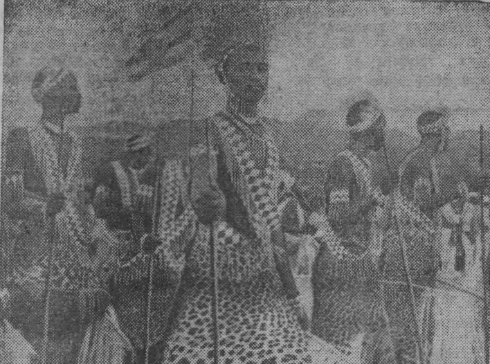
28 ноября этого года республике Бурунди исполняется 5 лет. Это небольшое государство в Восточной Африке, территория которого — 27,8 тысячи кв. километров, а население всего 3,5 миллиона человек, расположено чуть южнее экватора. В 1962 году народ Бурунди освободился от опеки Бельгии, а в 1966 году произошел переворот, в результате которого монархический строй был свергнут и Бурунди провозглашена республикой. На снимке: лучший танцевальный ансамбль страны из провинции Муинга. Он известен далеко за пределами Бурунди. На переднем плане — участник ансамбля в шкуре леопарда. Точно такая же фигура воина украшает денежные знаки республики.