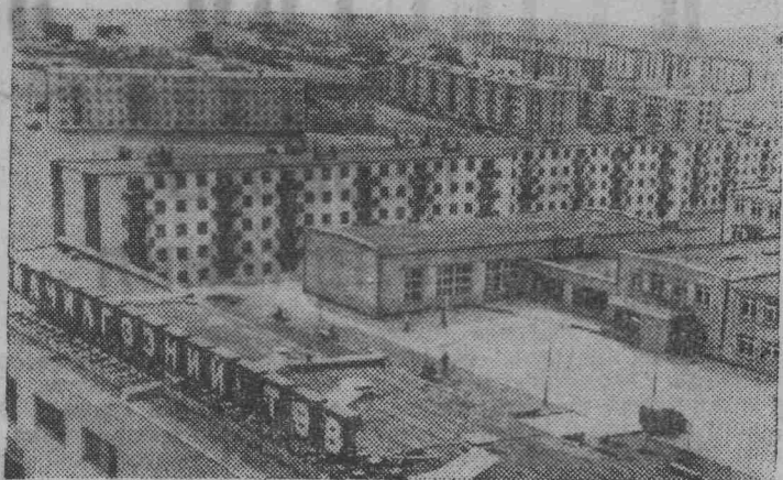
МОНГОЛИЯ. Советский Союз принимает участие в создании основных индустриальных центров республики. С его помощью строятся или расширяются свыше 250 промышленных и сельскохозяйственных предприятий.