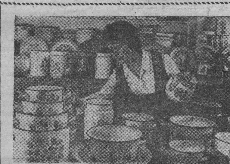
ПЕРМСКАЯ ОБЛАСТЬ. Лысьевский металлургический завод — крупный поставщик эмалированной посуды. В текущем году с конвейера предприятия сойдет 34 миллиона штук изделий — это на 10 миллионов больше, чем в прошлом году.

Коллектив непрерывно совершенствует качество изделий, увеличивает выпуск посуды светлых тонов и расцветок.