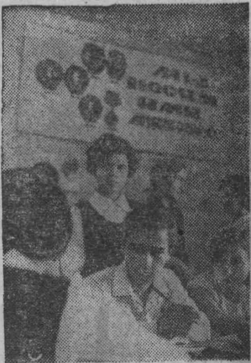
САРАТОВСКАЯ ОБЛАСТЬ. Комсомольцы Балаково создали городской штаб «Факел», который является центром

изучения и распространения опыта работы школьных комсомольских организаций. Он устраивает радиопередачи, подводит итоги соревнования комсомольских организаций, проводит общегородские тематические конференции, организует вечера старшеклассников. Большое внимание уделяет штаб воспитанию школьников на трудовых и боевых традициях старшего поколения. Почти во всех школах созданы комнаты боевой и трудовой славы.