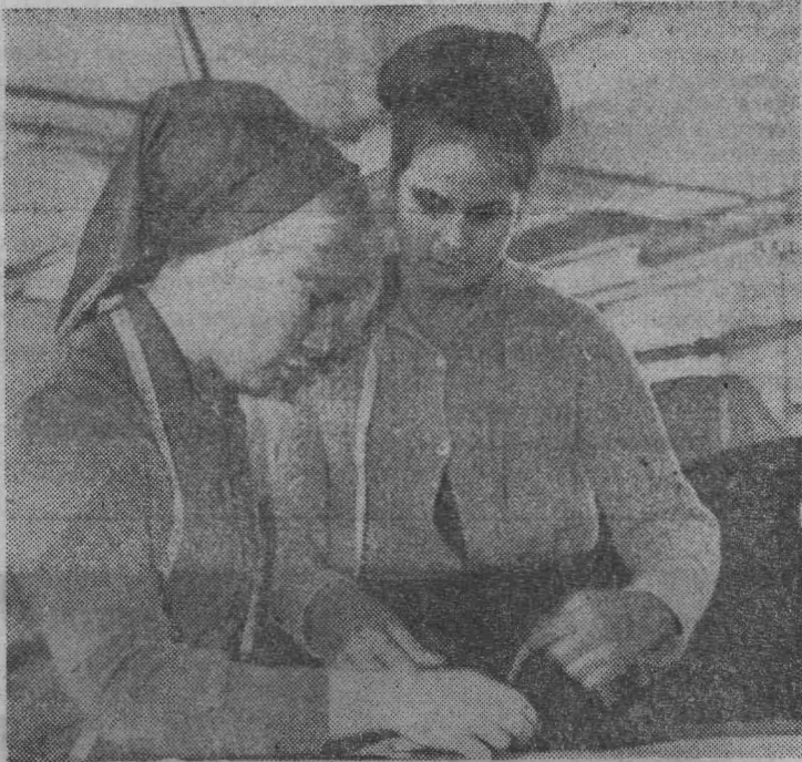
Швейное объединение «Одежда» — передовое предприятие нашего города. В канун праздника Великого Октября оно завоевало первое место в областном соревновании работников швейной промышленности Кузбасса. Не снижая темпов работы, коллектив швейников трудится в эти дни.