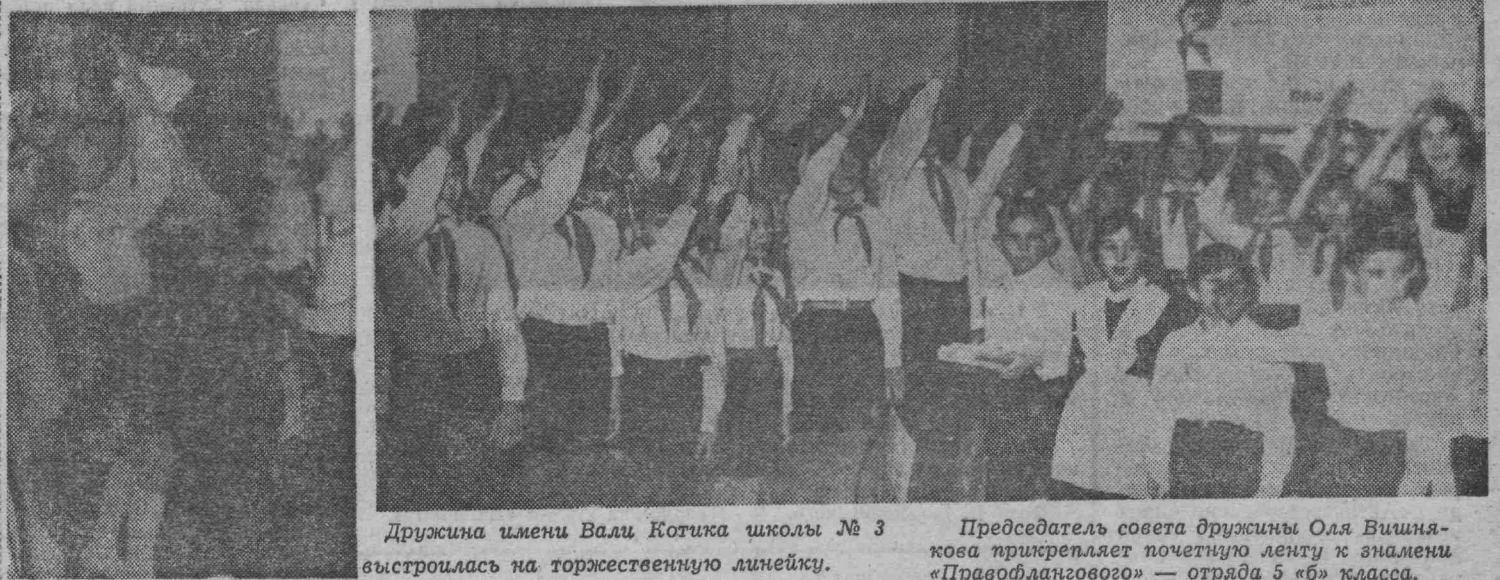
Дружина имени Вали Котика школы № 3 выстроилась на торжественную линейку.

Отряд 7 «а» класса им. Гюль Королевой школы № 36.