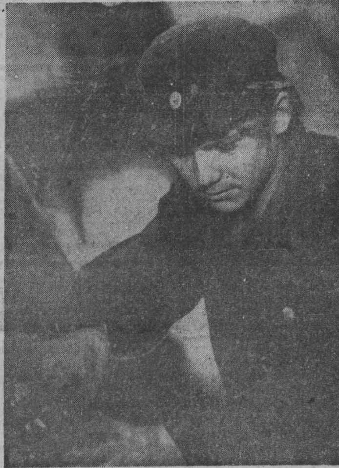
Для повышения долговечности автомобилей и срока службы агрегатов около трех месяцев назад в Кольчугинской автобазе была создана специальная бригада по техническому обслуживанию автомобилей.

труда. Она выше плановой на 7,4 процента. Каждый работник фабрики нынче выпустил за год 2588 пар обуви — это лучший показатель среди работников родственных предприятий области. За счет снижения себестоимости продукции, снижения расхода материалов получено более 60 тысяч рублей прибыли. Рентабельность предприятия поднялась на 7 процентов.