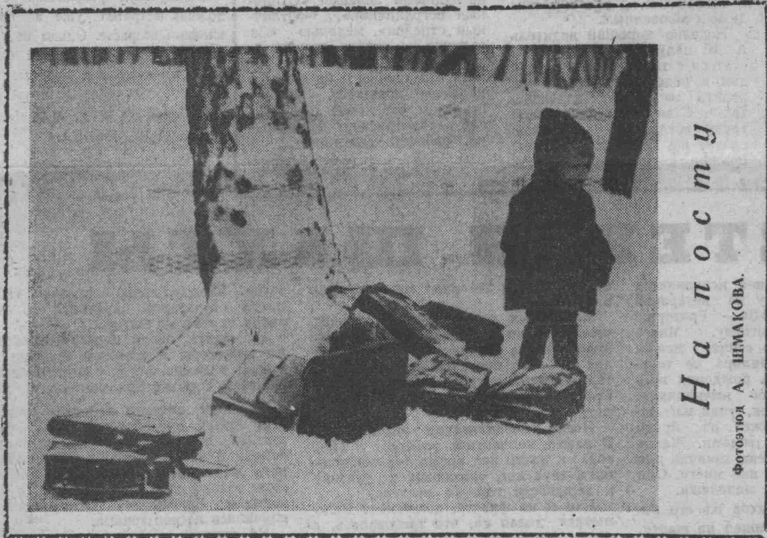
На посту