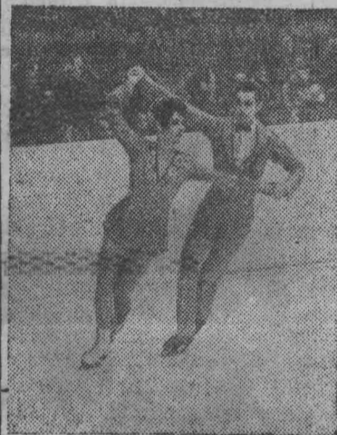
На чемпионате Европы по фигурному катанию, проходившем в Цюрихе (Швейцария), чемпионами в танцах на льду стали советские спортсмены Людмила Пахомова и Александр Горшков.