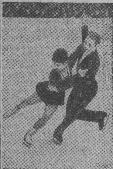
На чемпионате Европы по фигурному катанию, проходившем в Цюрихе (Швейцария), чемпионами в парном катании стали советские спортсмены Ирина Роднина и Алексей Уланов.