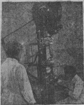
Испытание ткани на разрыв для парашюта спускаемого аппарата автоматической межпланетной станции «Венера-7». (Кадр из цветного научно-популярного фильма «К планете загадок» производства студии «Центрнаучфильм»).