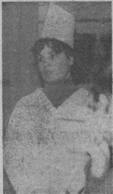
Идет Ленинский урок