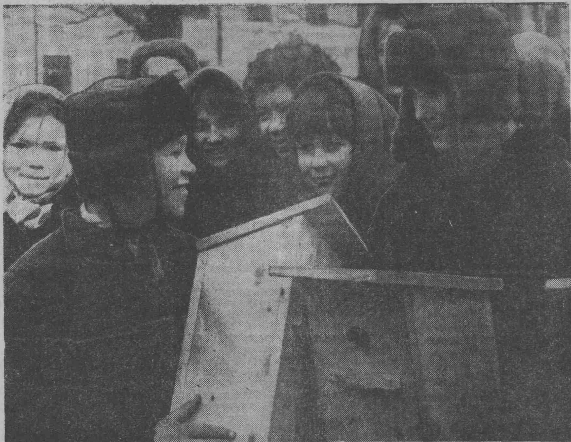
Весна! Скоро прилетят скворцы. Пионеры школы № 34 заранее готовятся к встрече со своими пернатými друзьями.

В задачи журнала входит всесторонняя и аргументированная критика современных буржуаз-