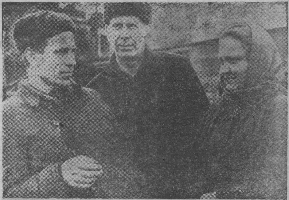
Химический участок завода полукоксования в предсъездовском соревновании добился лучших результатов в труде. Этот коллектив достойно продолжает нести вахту в дни работы партийного съезда. Рабочие и ИТР участка наращивают выпуск сверхплановой продукции.