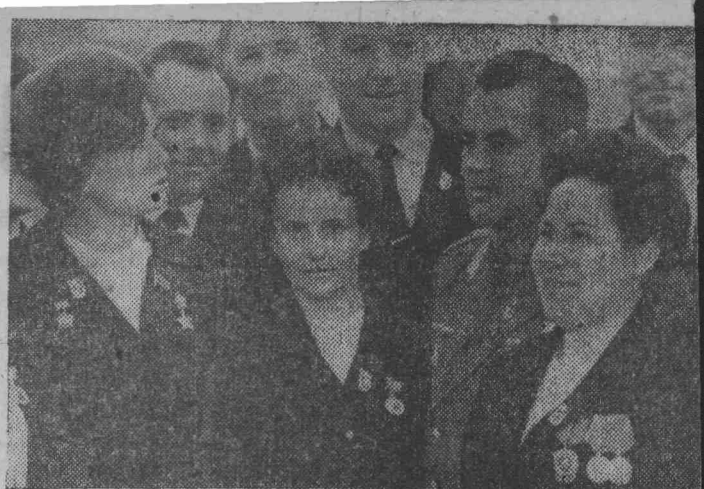
МОСКВА. XXIV съезд КПСС.

Газета основана 1 октября 1930 г. ♦ № 71 (10171) ♦ Вторник, 13 апреля 1971 г. ♦ Цена 2 коп.