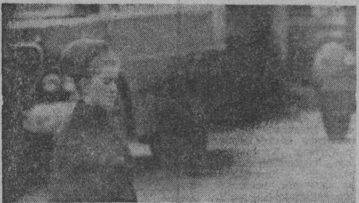
На снимке: девушку не волнует отчаянный визг тормозов. Она убеждена, что автомобиль на ее наехать не может — не имеет права. К сожалению, нам не удалось унять ее фамилию и имени.

На посту ГАИ получен тревожный сигнал от общественных автоинспекторов: по поселку Лапшиновка разъезжает пьяный шофер на автомобиле ГАЗ-51. Госавтоинспектор А. М. Таранов принимает экстренные меры.