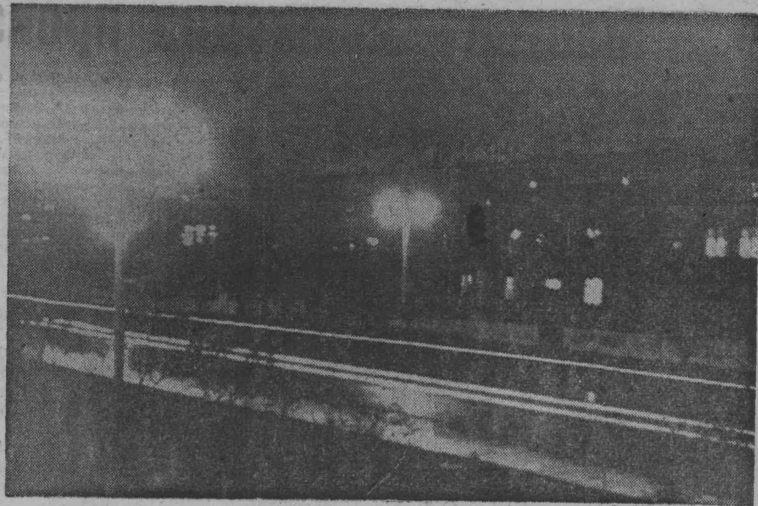
НАШ ГОРОД ВЕЧЕРОМ, ПОСЛЕ ЛЕТНЕГО ДОЖДЯ.

Плывет над степью гул мотора. Разлуку чью-то кулики Оплакивают на озерах. Заметив птиц над косогором, Вдруг забываешь, что стоишь... И вот уж, кажется, летишь Над тем врачующим простором... А ты о море говоришь. Н. ПИСКАЕВ.