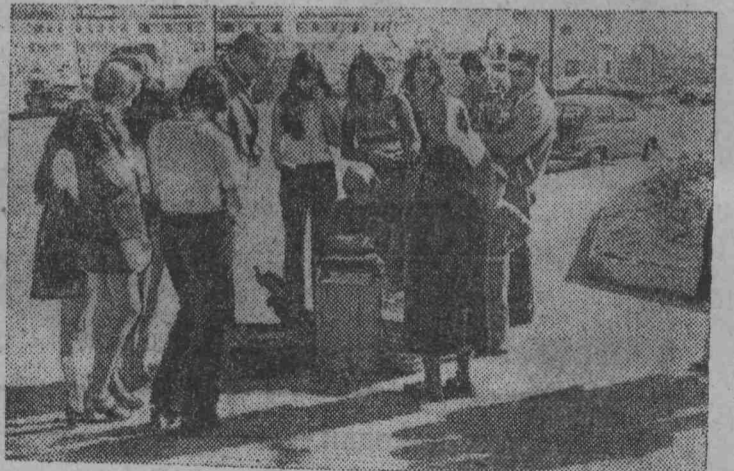
Ла-Корунья — один из крупнейших портов Испании. С утра до позднего вечера плетет кружева эта пожилая женщина у ворот порта — места частого посещения туристов. Иногда ей даже удается продать плоды своего творчества.

11 ИЮНЯ I ПРОГРАММА. Москва. 12.00 Программа передач. 12.05 Новости. 12.10 «Музыкальный киоск». 12.40 Для школьников. «Ответы на тысячу почему». «Человек под водой». 14.00 «Сегодня — День работников легкой промышленности». 14.30 Концерт. 15.15 «Всего три недели». Премьера художественного телефильма, 2-я серия. 16.20 «Клуб путешественников». 17.20 Эстрадный концерт. 18.00 «Время». 18.30 «Дорога на Рыбецаль». Художественный фильм. 20.00 «Творчество народов мира». Кемерово. 20.30 Программа передач. 20.31 Музыкальный диалог. Москва. 22.00 «Ваше мнение...» Ведет передачу О. Доброхотова. 23.00 «Время». II ПРОГРАММА. 19.28 Программа передач. 19.30 «Мерос — наследство». Телефильм. 19.45 «Весна на Одере». Художественный фильм.