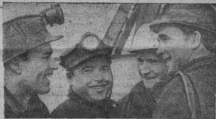
КАЗАХСКАЯ ССР. Коллектив шахты «Казакстанская» Карагандинского угольного бассейна, соревнуясь в честь предстоящего юбилея образования Советского государства, обязался выдать 150 тысяч тонн угля сверх годового задания.