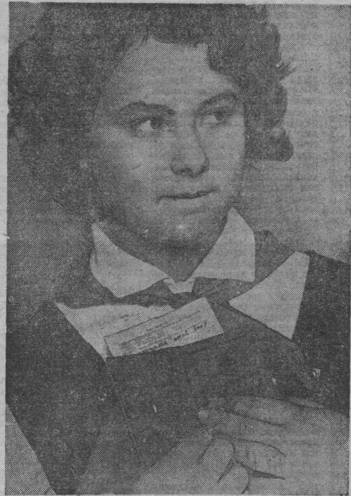
МОЙ КОМСОМОЛЬСКИЙ БИЛЕТ

★ ★ ★ За два прошедших года в ряды ВЛКСМ принято 6813 человек.