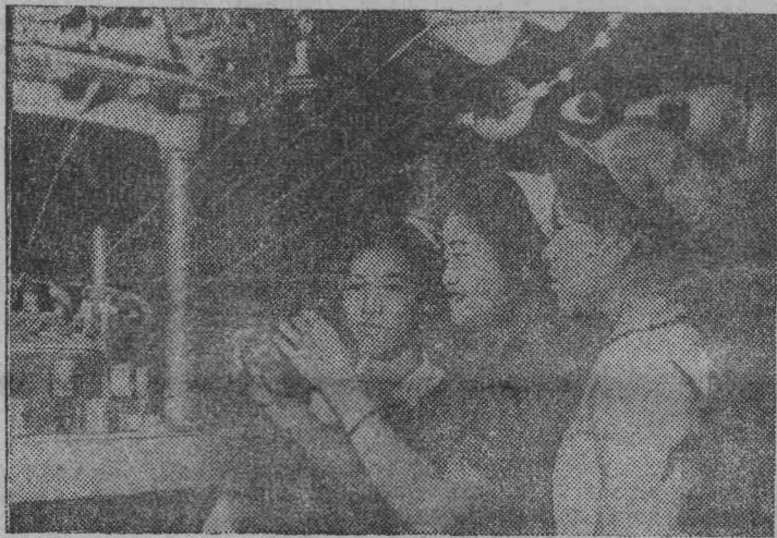
ДРВ. Несмотря на трудные условия военного времени, текстильщики Ханоя продолжают выпускать высококачественную продукцию. В цехах предприятий не прекращаются работы по совершенствованию технологического процесса обработки тканей.

На снимке: бригада прядильщиц одного из текстильных предприятий в Ханое.