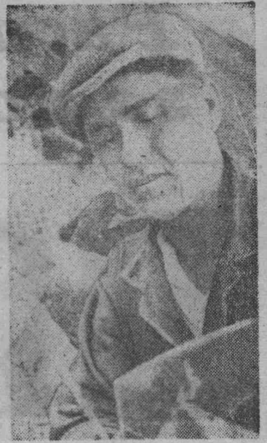
мороз не берет.

И он шел, делал как положено. Быстро стал в бригаде своим. Теперь у него четвертый разряд. И с климатом подружился. В одной куртке