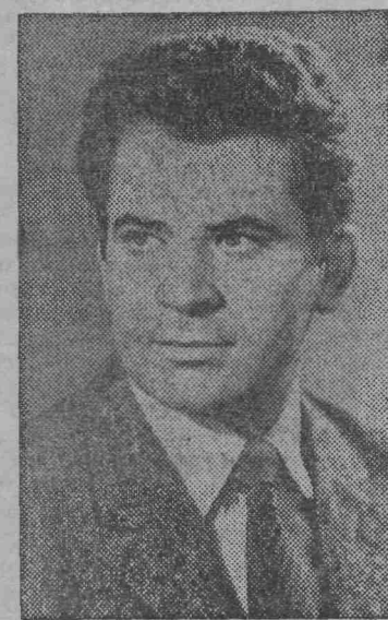
На снимке: Борис Спасский.

Матч состоит из 24 партий и будет продолжаться, пока один из противников не наберет 12,5 очка. Если матч закончится вничью, Борис Спасский сохранит титул чемпиона мира.