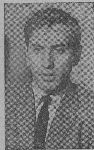
На снимке: Роберт Фишер.