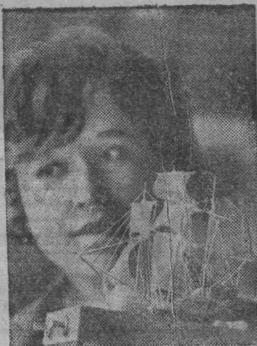
МОСКВА, 300 различных приборов — такова экспозиция традиционной выставки столичных радиолюбителей, посвященной 50-летию образования СССР.