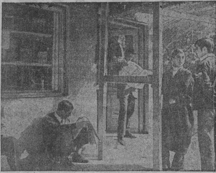
Алжирская Народная Демократическая Республика. У книжной лавки в городе Бискара. Жители знакомятся с последними новостями.