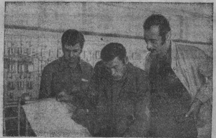
Советский Союз оказывает Турции помощь в сооружении промышленных объектов, имеющих принципиальное значение для развития и укрепления ее национальной экономики. Среди них — нефтеперерабатывающий завод в Алиага, под Иамиром. Его строительство началось в 1968 году и ведется при техническом содействии СССР. На снимке: советские и турецкие специалисты за обсуждением работы в операторной на заводе в Алиага.