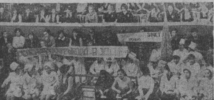
Делегаты медицинского училища.

В решении таких вопросов, как распределение квартир, мест в детских садах и яслях, партийная и профсоюзная организации всегда поддерживают мнение комсомольцев. В тесном взаимодействии с шахтовым профсоюзом комитет ВЛКСМ обсуждает условия социалистического соревнования комсомольско-молодежные