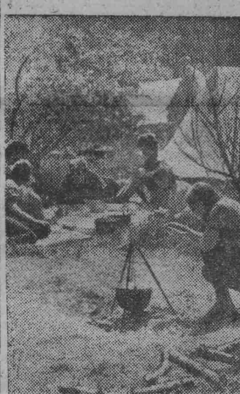
Ростов-на-Дону. В выходные дни тысячи ростовчан устремляются на левый берег Дона, где в зелени листвы над рекой расположены многочисленные базы отдыха. Немало здесь красивых мест и для любителей туризма.

На снимке: так предпочитают отдыхать учащиеся ростовского механического техникума.