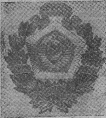
Юбилейный почетный знак ЦК КПСС, Президиума Верховного Совета СССР, Совета Министров СССР и ВЦСПС в ознаменование 50-летия образования Союза ССР.