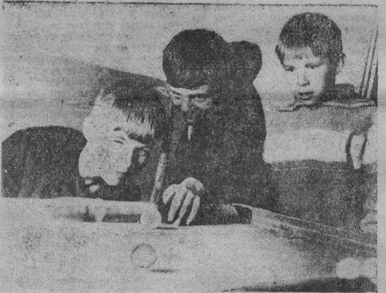
Текст и фото И. ЯКОВЛЕВА.

Большие планы у детской комнаты на лето, на год. И, в общем-то, выполнимые.