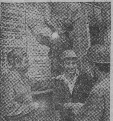
Грузинская ССР. «Пятнадцать республик — пятнадцать трудовых вахт» — под таким девизом развернулось социалистическое соревнование в честь 50-летия СССР на Батумском нефтеперерабатывающем заводе.

Каждые 15 дней трудовая вахта на предприятии проходит под знаменем одной из союзных республик. Первым был поднят флаг РСФСР.