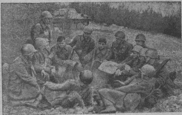
Политинформация на привале.