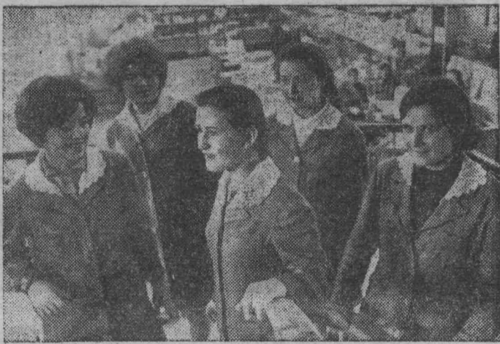
Молдавская ССР. Большой популярностью пользуется универсам «Южный» у жителей районного центра — города Кагула.