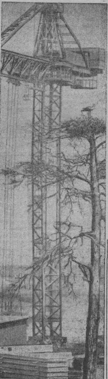
На строительстве Рижской ГЭС в нескольких метрах от котлована на сухой осе — гнездо аистов. Несмотря на грохот стройки, массу людей и машин, вот уже четвертую весну аисты возвращаются в это гнездо. Говорят, к счастью.

Родители: ВДОВЕНКО, КИСЕЛЕВА, ТЕРЯЕВА и другие.