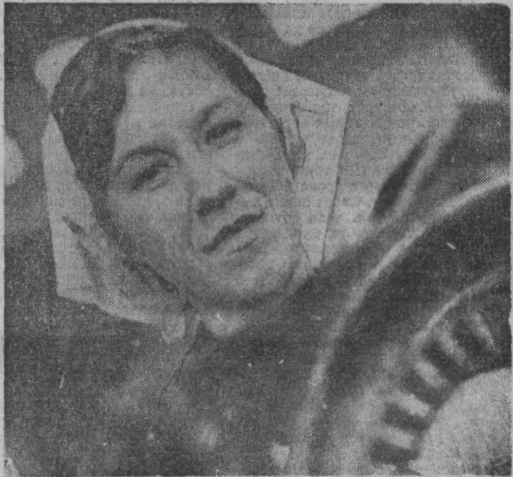
Разные марки электродвигателей поступают для ремонта в электроцех завода «Красный Октябрь». Здесь на них заменяют обмотку.

Все это воспитывает у ребят уважение к другим странам, традициям и культуре другого народа, рождает чувство солидарности и озабоченности их историческими судьбами.