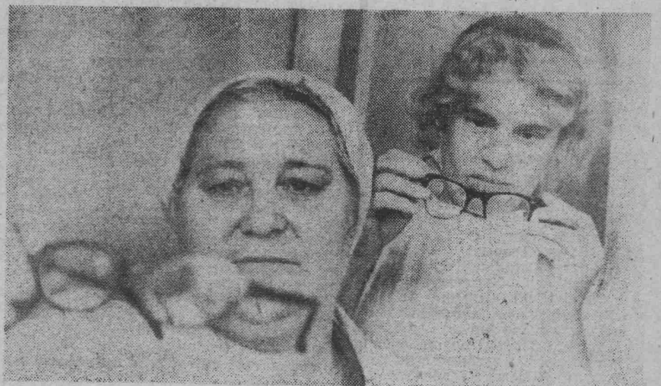
Аптекарский магазин, отдел «Оптика». Сюда приходят клиенты и подают почтовую открытку, извещающую, что их заказ уже выполнен. «Мы даже не ожидали, что так быстро будут изготовлены по рецепту очки».

Центральная канализация и отопление дома будут произведены при плавном капитальном ремонте.