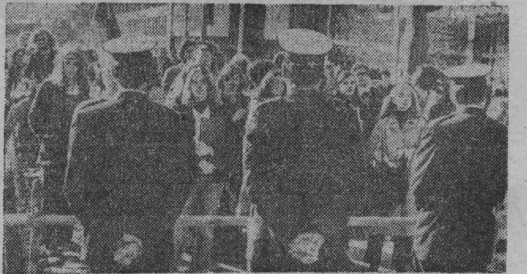
Молодежь Австралии решительно выступает против участия страны в агрессивном блоке СЕАТО.

ВАШИНГТОН. Колоссальные военные расходы являются на протяжении последних лет главной причиной инфляции в США, заявил кандидат на пост президента США от демократической партии сенатор Дж. Макговерн. Сенатор обещал внести на рассмотрение конгресса законопроект, запрещающий и правительству увеличивать расходы на военные цели.