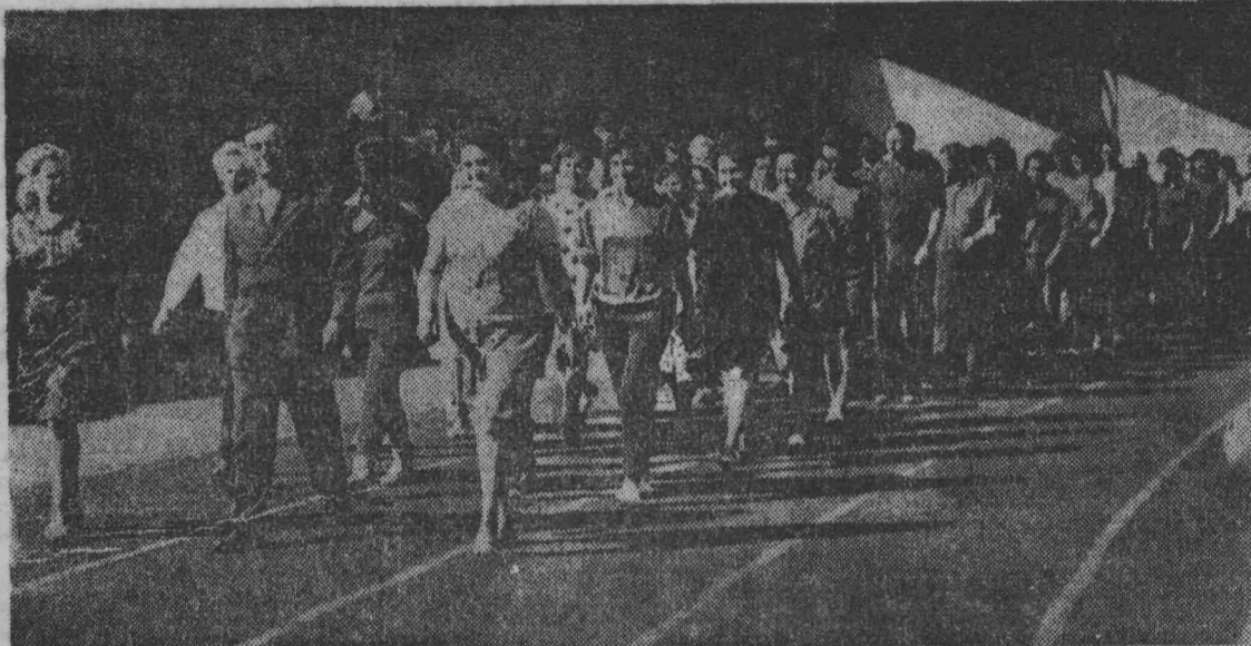
Наснимке: на параде.