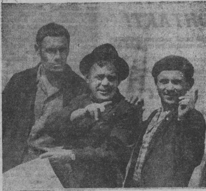
Идет строительство микрорайона № 1, где будут жить рабочие камвольно-суконного комбината. Забивку свай под фундамент 119-квартирного дома ведет Ленинский участок механизации.

При норме 15 свай за смену, механизаторы забивают по 25—30 штук.