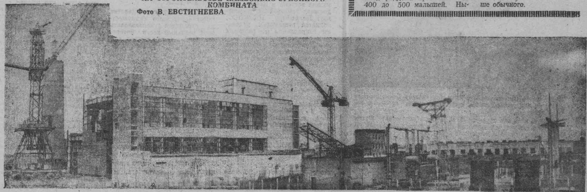
НА СТРОИТЕЛЬСТВЕ КАМВОЛЬНО-СУКОННОГО КОМБИНАТА

В обязательствах каждого строительного коллектива на второй год пятилетки находят полное отражение эти общие требования. Они имеют определенную и конкретную цель. Достижение их бригадой, участком, управлением, трестом будет лучшим деловым ответом.