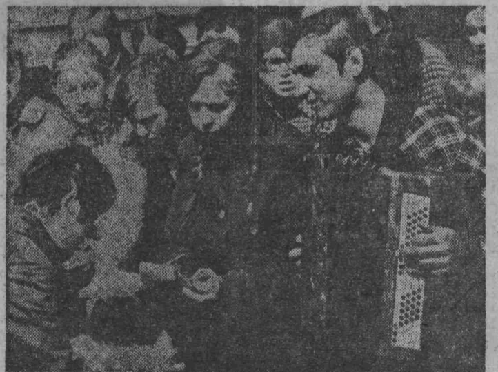
На снимках: за разучиванием новой пионерской песни; выступают горняк и барабанщики на показательных занятиях.