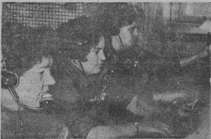
— Шахта «Комсомолец». Союзинию. — Почти ежеминутно повторяют эти слова телефонистки.

Заведливость и аккуратность они давно заслужили уважение многочисленных абонентов.