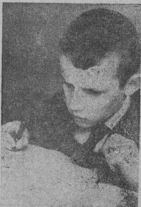
ТРУДНАЯ КОНТРОЛЬНАЯ.

СЕКРЕТАРЬ ГК КПСС подробно остановилась на воспитании молодежи в духе советского патриотизма, дружбы народов СССР и братской солидарности с трудящимися