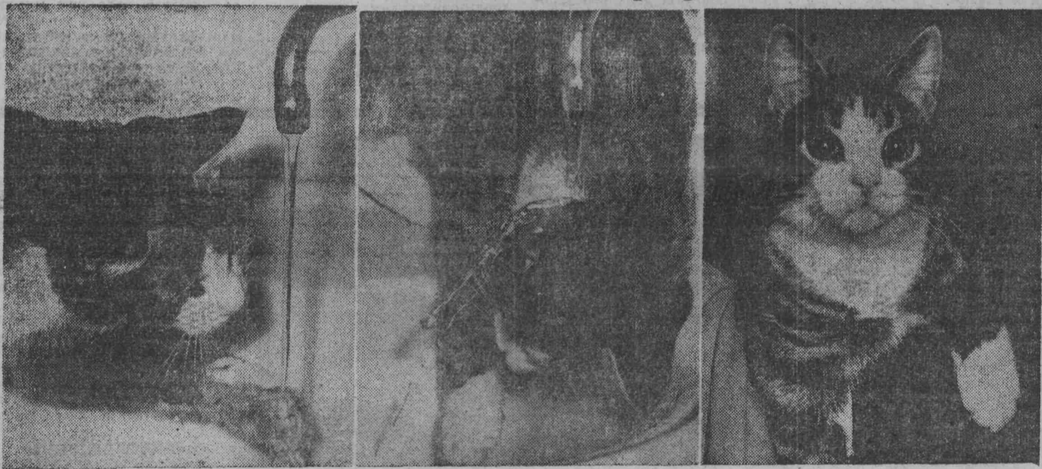
● Чистота — залог здоровья ● Фотоэтиюд Э. Костромина