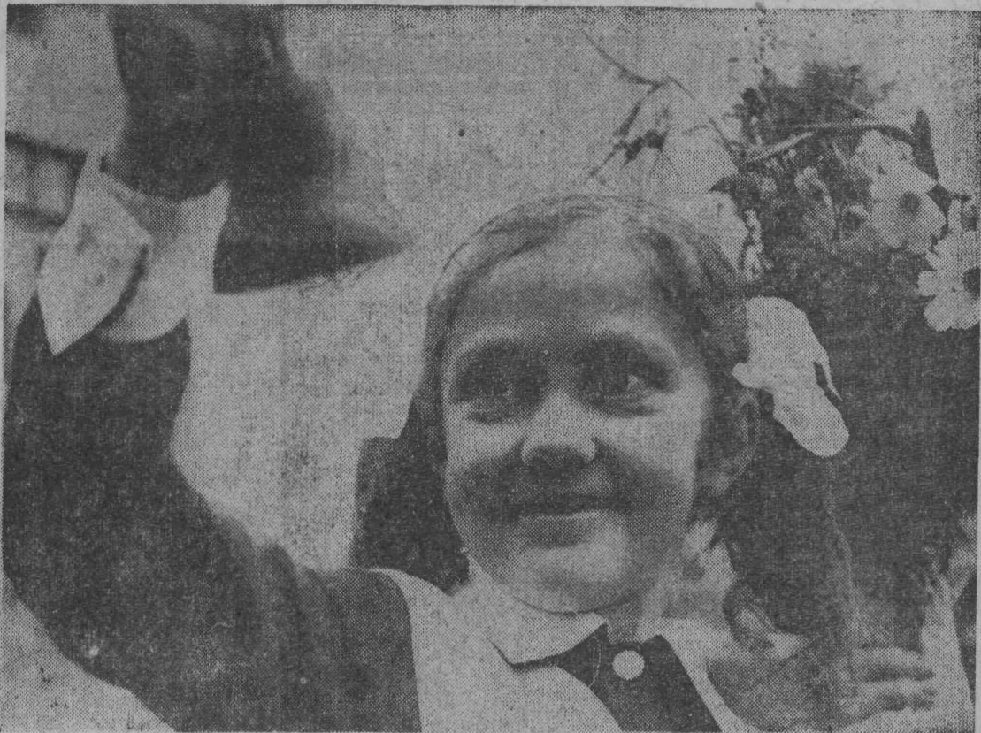
● НАШИ ИНТЕРВЬЮ

Лицо молодого поколения — его дела. Дела, которые уже были, которые свершаются сегодня, и те, которые будут завтра. И в них — доля труда учителя, его неутомимой энергии. Пусть наши выпускники будут достойной сменой тем, кто успешно строит коммунизм!