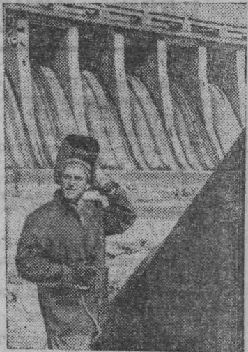
Запорожская область. Днепровской гидроэлектростанции имени В. И. Ленина исполняется 40 лет.

Первый промышленный ток станция дала в 1932 году. За четыре десятилетия существования здесь выработано более 90 миллиардов киловатт-часов электроэнергии. Благодаря телемеханизации и автоматизации станция на обслуживание ее агрегатов в смене трудится всего шесть человек.