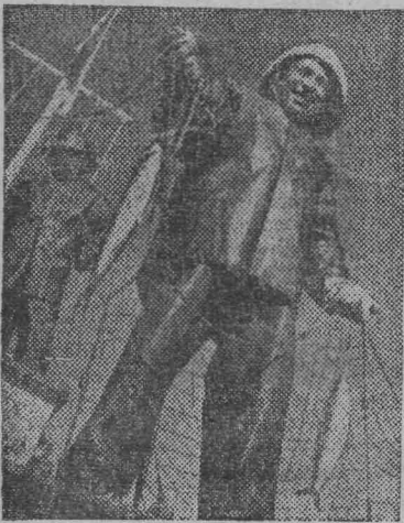
БАЙКАЛ неповторимый уголок нашей земли, средоточие сказочных богатств и красоты...

В этом величайшем озере-море находится 4/5 мировых запасов поверхностных пресных вод, самых чистых на планете. Достаточно сказать, что впадина Байкала может вместить всю воду Балтийского моря, девяносто двух Азовских и двадцати трех Аральских или воду всех пяти Великих озер Америки, вместе взятых.