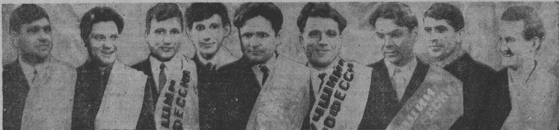
На шахте «Кольчугинская» много горняков, которых по праву называют мастерами по добыче угля. Много! Чтобы выявить лучших из лучших, администрация, партийная и профсоюзная организации шахты устроили конкурс. В нелегком трудовом соперничестве пришлось горнякам оспаривать первенство.

Для участников торжественного собрания был дан большой концерт.