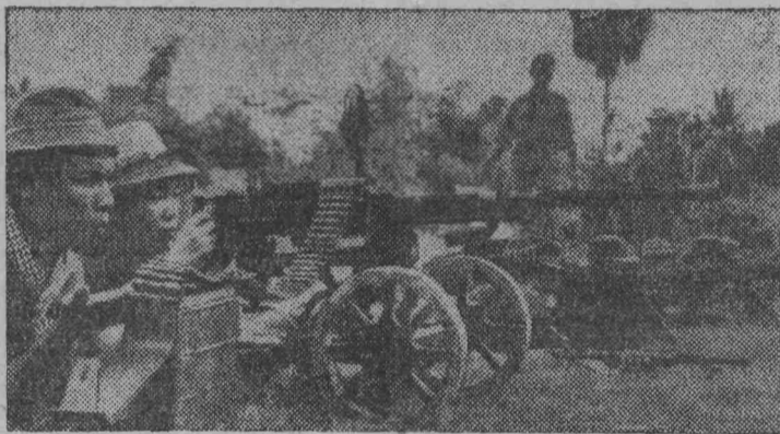
Камбоджа. Пномпеньская армия под ударами патриотов теряет одну позицию за другой. В результате успешных наступательных операций патриотов на юго-востоке страны зона боев продвинулась непосредственно к столице, охватив районы левобережья Меконга. На снимке: камбоджийские патриоты во время учебных стрельб.

Я. ГАВРЮТЕНКОВ, токарь электроцеха ЦЭММ.